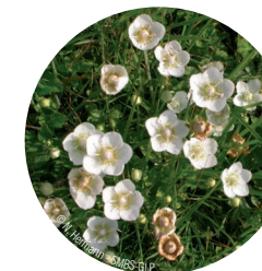
Parnassie des marais

Pour pallier la fermeture progressive et la disparition des pannes, des travaux de déboisement et de dessouchage ont été réalisés. Le curage de mares a permis la réapparition d'espèces végétales dont les graines étaient enfouies dans la terre. Chaque année, des fauches sont réalisées pour maintenir le milieu ouvert et accueillir toujours autant d'espèces.